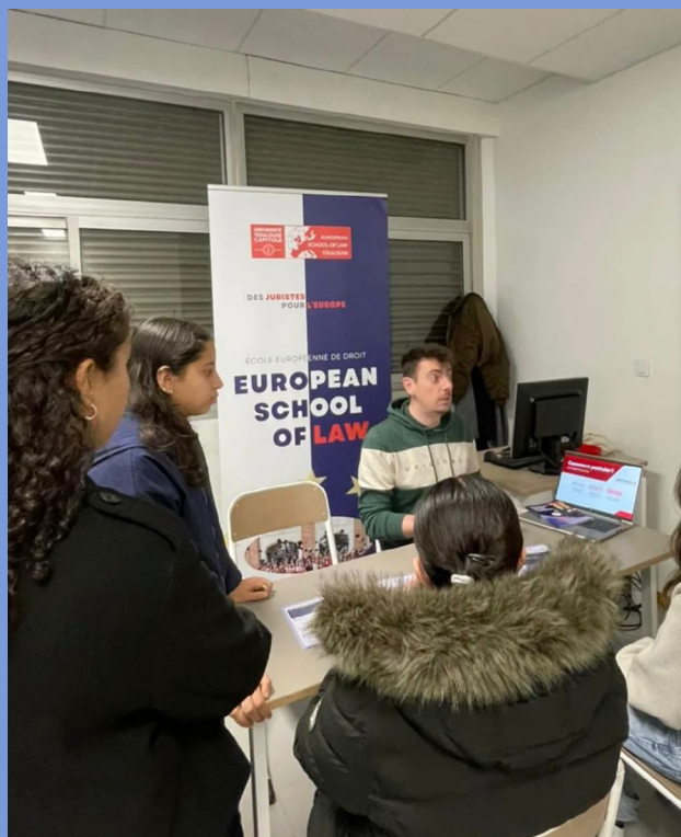
Présentation au lycée International Victor Hugo de Colomiers le 21 janvier.