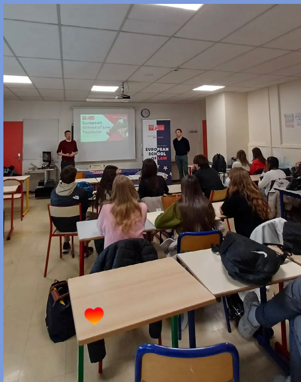
Présentation au lycée Joséphine Baker le 06 janvier.

D'autres forums sont à venir en février, et ce jusqu'à la clôture de la campagne de vœux Parcoursup.